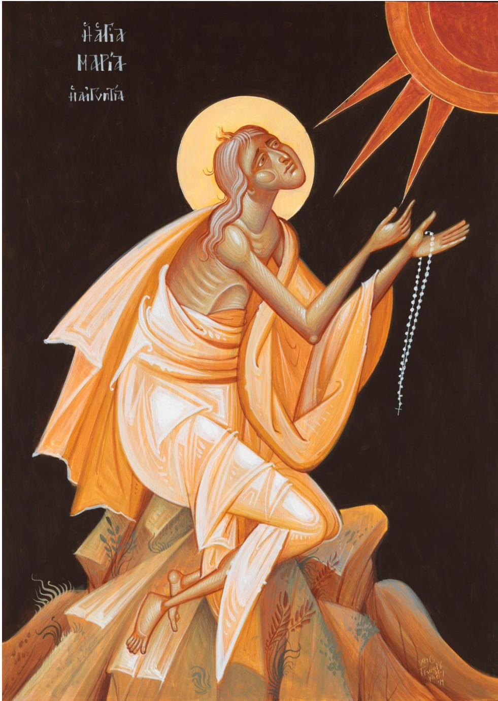
Saint Mary Of Egypt - George Kordis

GREEK ORTHODOX ARCHDIOCESE OF AMERICA GREEK ORTHODOX METROPOLIS OF NEW JERSEY